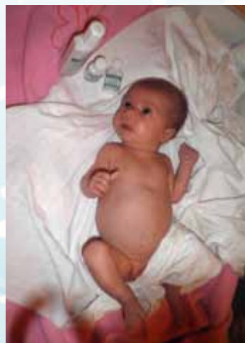
S Hadkem od narození, mamka jen od puberty...

dětských nemocí. Oleje, které používáme a doporučujeme, jsou od firmy Aromaterapie Karel Hadek. Nejvíce ohlasů má mandlový olej a olej z meruňkových jader, který je vhodný na pokožku podrážděnou z plen a také pupalkový olej obsahující kyselinu GLA, která je součástí mateřského mléka. Také velmi oblíbený je baby dětský masážní olej na běžné denní použití s obsahem všech potřebných vitamínů pro dětskou pokožku. Dále maminkám doporučujeme levandulový olej pro celkové zklidnění dětí a navození harmonického spánku a fenýklový olej pro děti trpící zažívacími obtížemi a k podpoření laktace u kojících maminek. Z řady éterických olejíčků pracujeme s citrusovými vůněmi, které mají děti nejraději, protože uklidňují, osvěžují a také posilují spánek. Při nachlazeních, chřipkách atd. využíváme eukalyptový olej, meduňkový, a také z borovicového jehličí. Všechny jmenované produkty je možné zakoupit v obou centrech Baby klubu Nekky ve Zlíně.