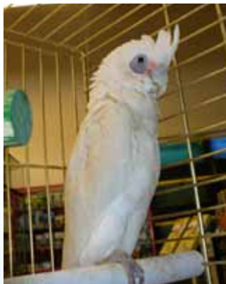
Levandule mne uspala, málem jsem spadla z bidýlka...