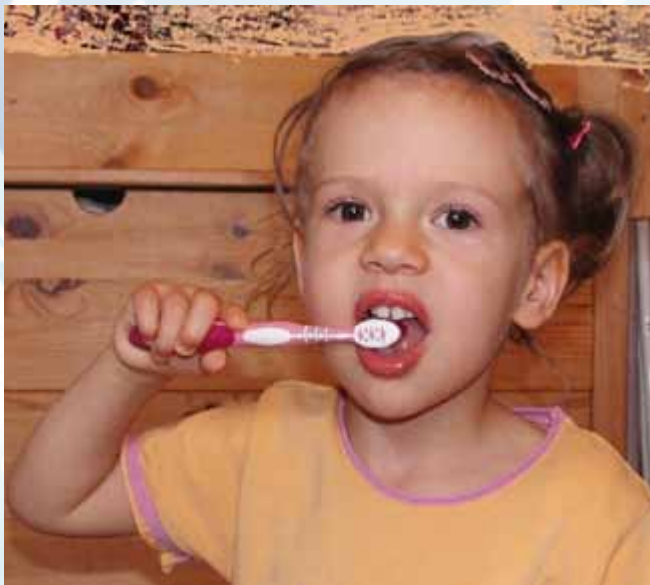
Chci mít čisté zoubky, a hlavně budu zdravá.

U dětí jde vše mnohem snadněji, obzvláště pokud se maminka začne o aromaterapii zajímat již před narozením